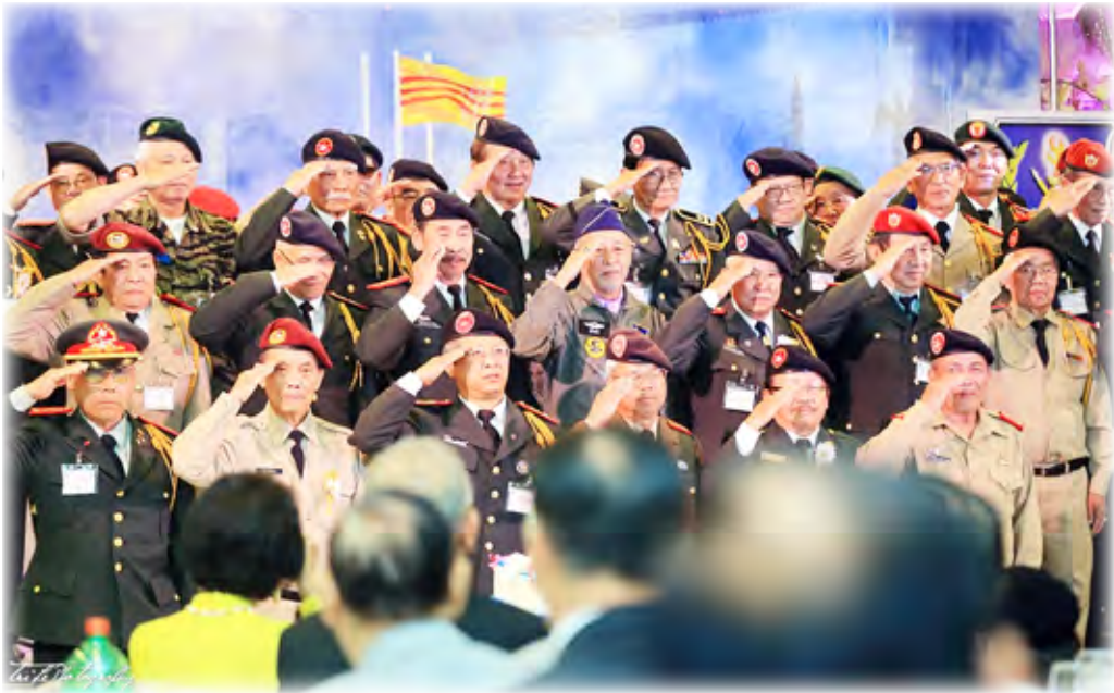
Các CSVSQ đang đồng ca bản nhạc “Võ Bị Hành Khúc” trong Đêm Dạ Tiệc ngày 24 tháng 6 năm 2018 tại Nam California.